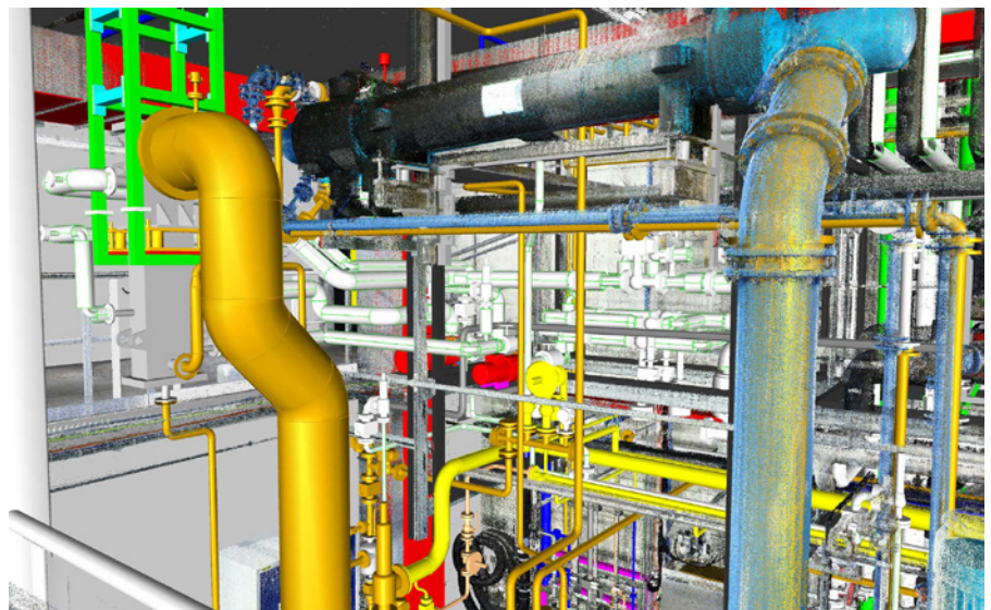
Abbildung 1: 3D-Laserscans erfassen den Ist-Zustand von Bestandsanlagen millimetergenau.

Die Entscheidung für CADISON fiel bei HINE ganz bewusst: nicht als Ersatz für ein Zeichentool, sondern als Fundament für durchgängiges datenbasiertes Arbeiten. „Früher war unsere Planung stark dokumentenzentriert. Jede Fachdisziplin führte ihre eigenen